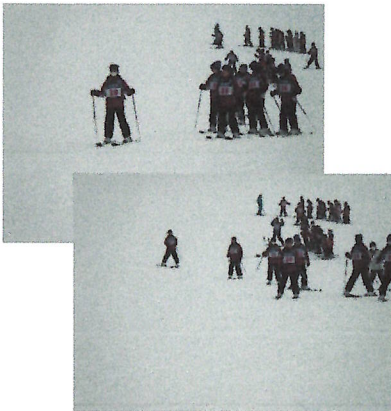
上級クラスは初日から しっかり滑っていました