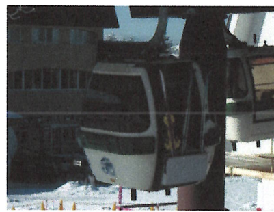
ゴンドラで頂上へ