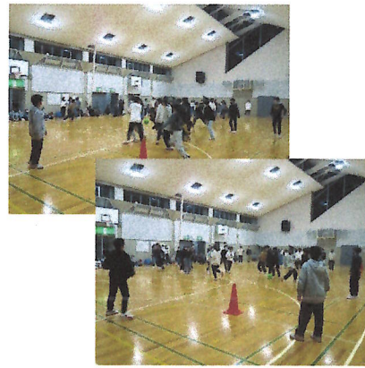
実行委員が企画・運営したレクリエーション (ドッチボール)