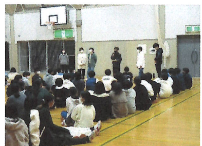
レクリエーション説明