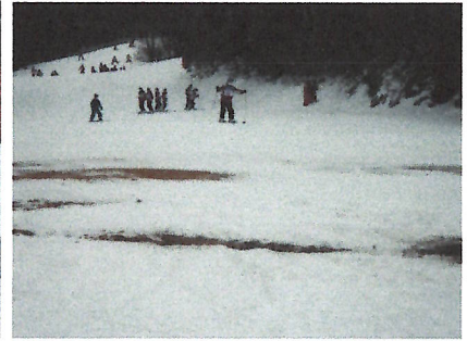
土の見えるゲレンデ