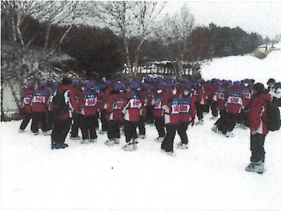
実習開始前の様子

《2日目》朝方まで降り続いた雨も、ゲレンデに向かう頃には雪に変わり、午前中の視界は悪い状況でしたが、ゲレンデの状況は良くなりました。