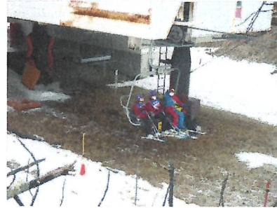
初めて?のリフト体験