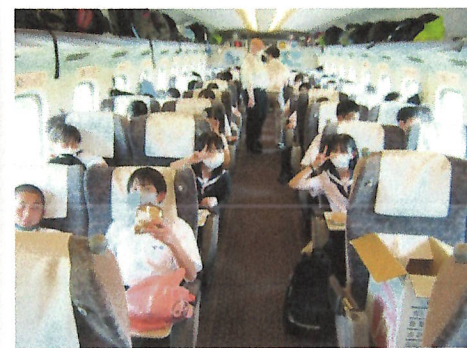
帰りはグリーン車