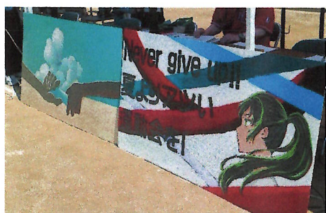
美術部作成の看板