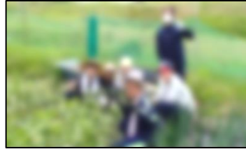
【農家さんでの農業体験】