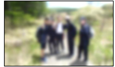
【霧ヶ峰・八島湿原ハイキング】

6月5日～7日に1年生・新苑学級1年生は女神湖移動教室に行ってきました。初日は霧ヶ峰・八島湿原のハイキング、二日目は班ごとに農業体験、三日目は牧場での乳搾り体験等、普段の生活とは違った、様々な体験をしました。実行委員会を中心に各係生徒、各班の班長など、生徒たちはそれぞれのクラスや班の仲間と協力し合いながら、三日間を過ごしました。中学校入学後、初めての宿泊行事でしたが、活動の様子はとても立派で、実り多い宿泊行事となりました。