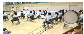
体育館でのリハーサル風景

8月7日(月)、第63回東京都中学校吹奏楽コンクール(8月4日～17日開催/府中の森芸術劇場)に吹奏楽部がB組(35名以下)に参加し演奏しました。曲目は「明日へ吹く風」という曲で、昨年度から選曲し練習を重ねてきました。1年から3年生の20名が、この日練習の成果を発表しました。審査員の方からは「全体のサウンドはうまくまとまっています。」「少人数ながらよくまとまった演奏です。」「明るく爽やかなスタートにふさわしいサウンドで、アンサンブルはよくまとまっています。」というコメントをいただきました。審査結果は銀賞で、生徒たちは充実した表情でした。